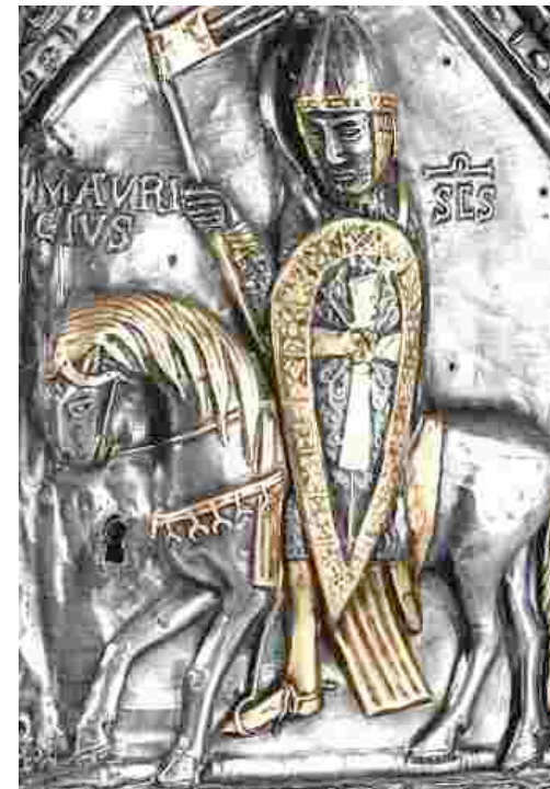
Abbaye de Saint-Maurice, trésor.